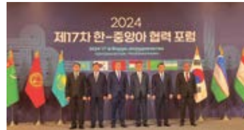
Центральной Азии и Республики Корея.

По итогам форума главы делегаций приняли Совместное заявление и Рабочий план секретариата форума на 2025 год, а также осмотрели выставку культурного наследия стран